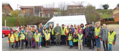
Matinée nettoyage en 2019

Réponse du CME : C'est déjà prévu, le 4 avril (à 8h45) sur la place du Marché aux Cerises pour une matinée nettoyage en famille. Ce sera l'occasion de se retrouver pour rendre notre commune plus propre, comme nous le faisons chaque année