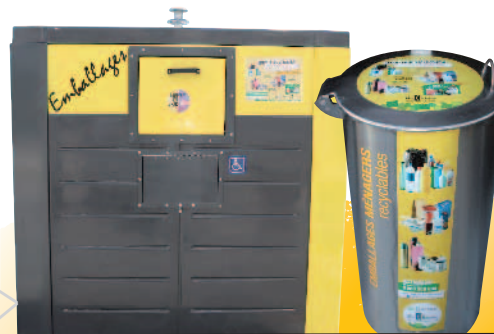
POINTS D'APPORT VOLONTAIRE