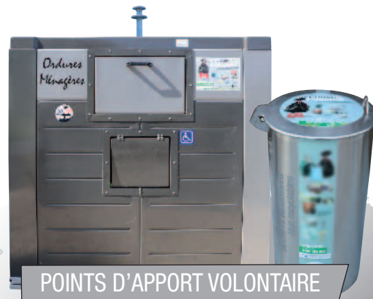
POINTS D'APPORT VOLONTAIRE

NE PAS UTILISER les sacs 100% compostables Une poubelle grise contenant un sac compostable ne sera pas collectée.