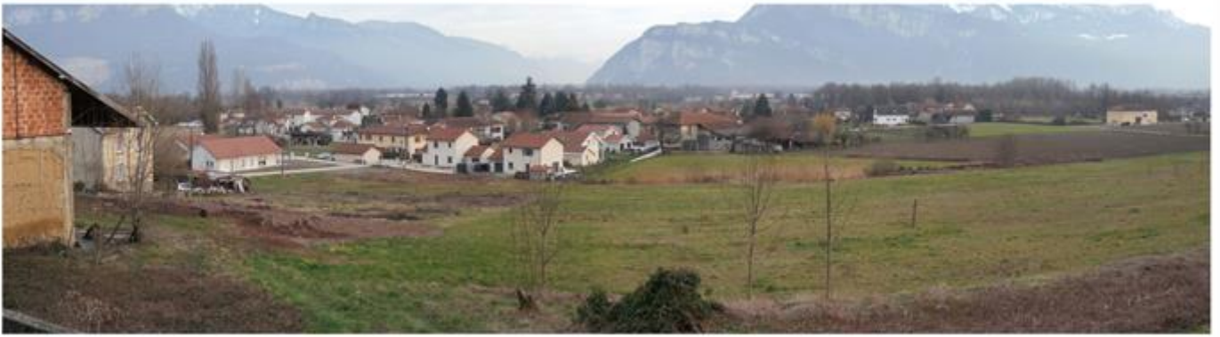
Vue depuis le haut du mur d'enceinte du manoir de la Colombinière, rue de la Colombinière

Bien que seuls quelques éléments de son architecture soient inscrits à l'inventaire des Monuments Historiques, c'est bien l'ensemble du manoir qui contribue à définir son identité, à savoir : son bâtiment, mais aussi son mur d'enceinte et enfin sa végétation, véritable point de repère dans le paysage environnant.